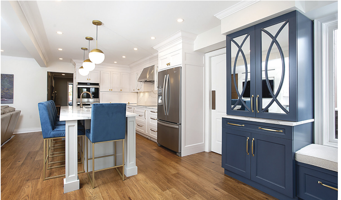
△ Hickory / Caryl-Barque | ENG716