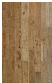
ENG716 HICKORY/CARYER BARQUE