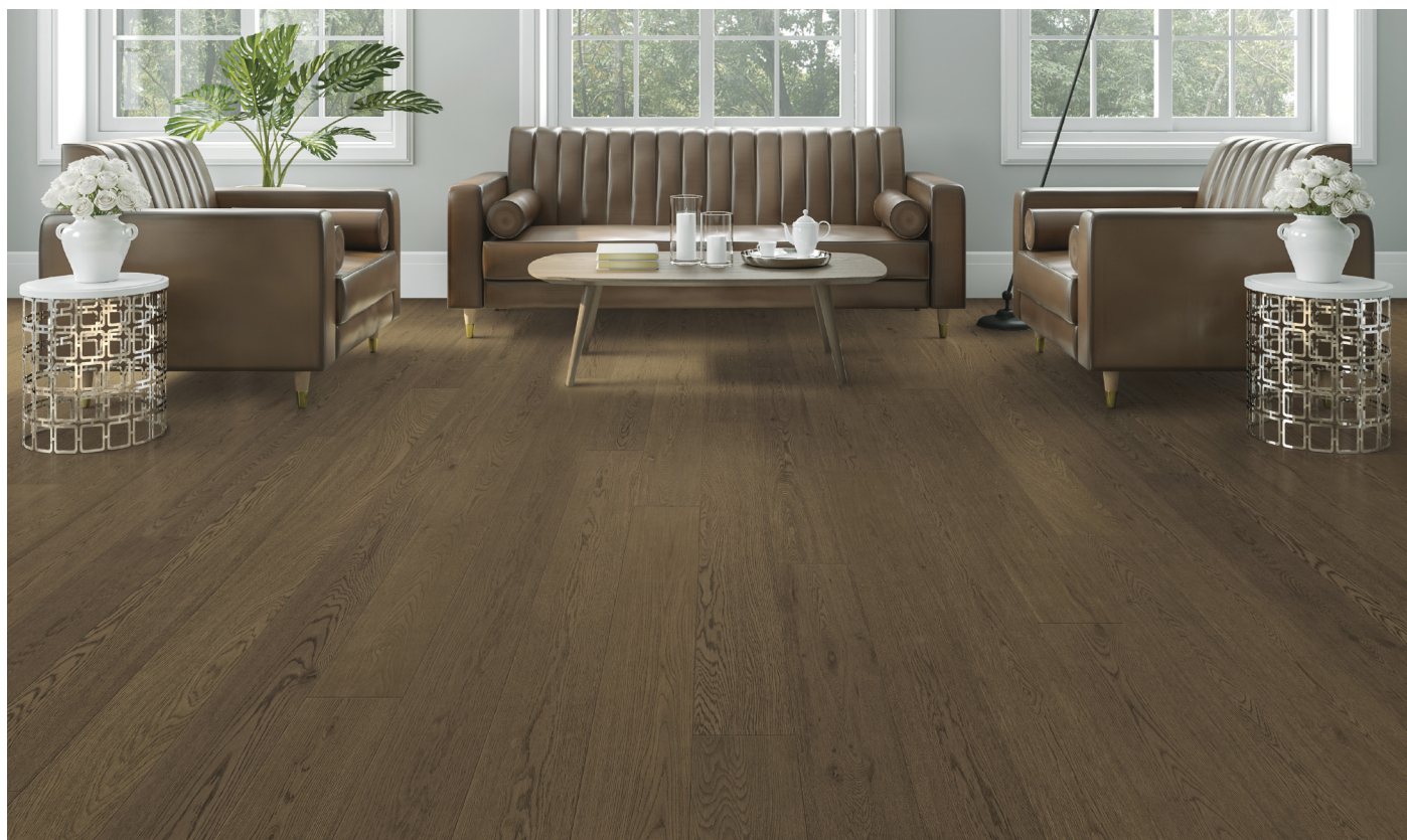
△ White Oak / Chêne blanc-Biscuit | ENG2503