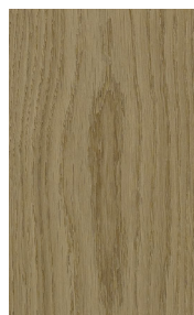
ENG2502 WHITE OAK/CHÊNE BLANC HONEYED HORIZON