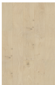
ENG728 WHITE OAK/CHÊNE BLANC BRIGHTON