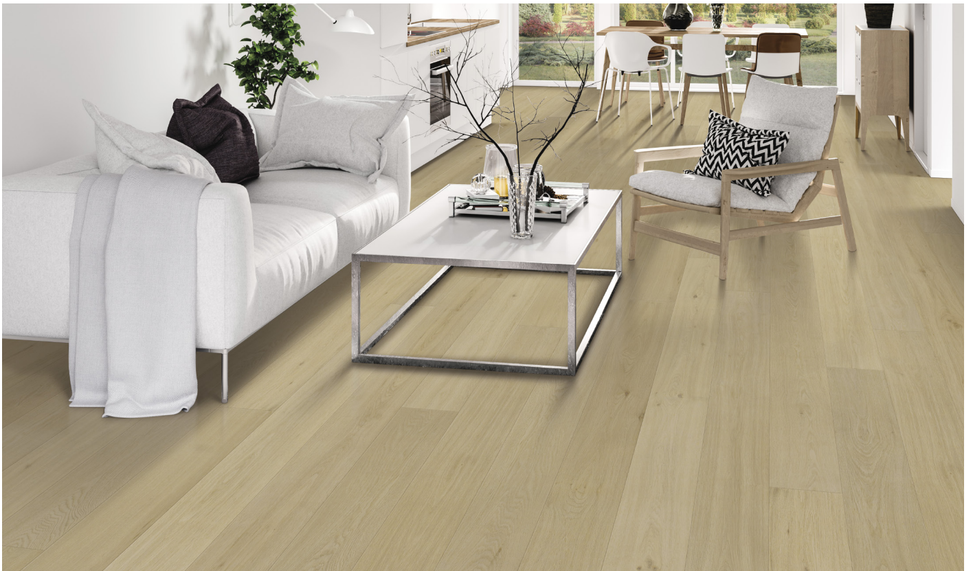
△ White Oak / Chêne blanc-Reflection | ENG2501