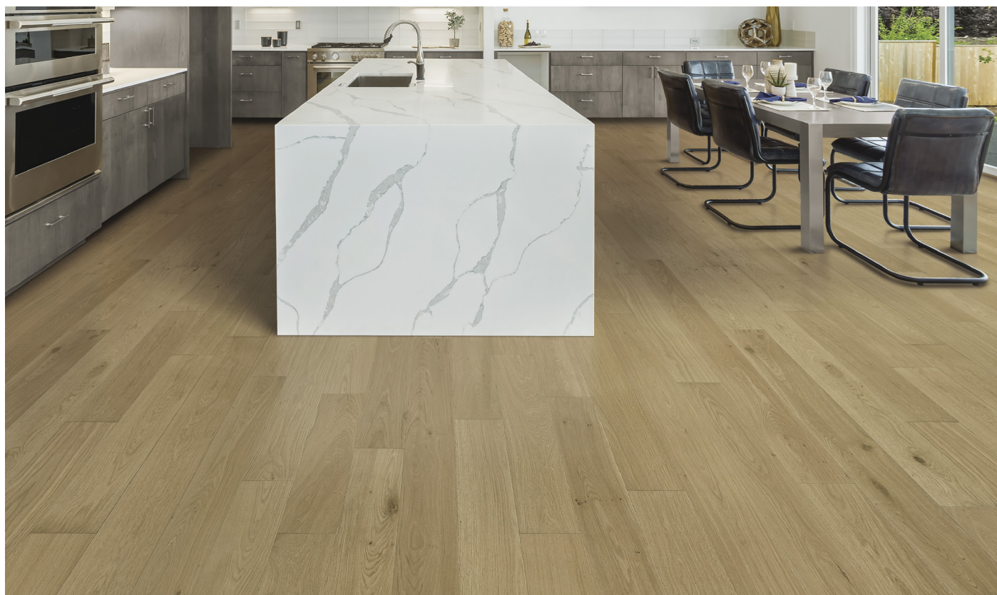
△ White Oak / Chêne blanc-Honeyed Horizon | ENG2502