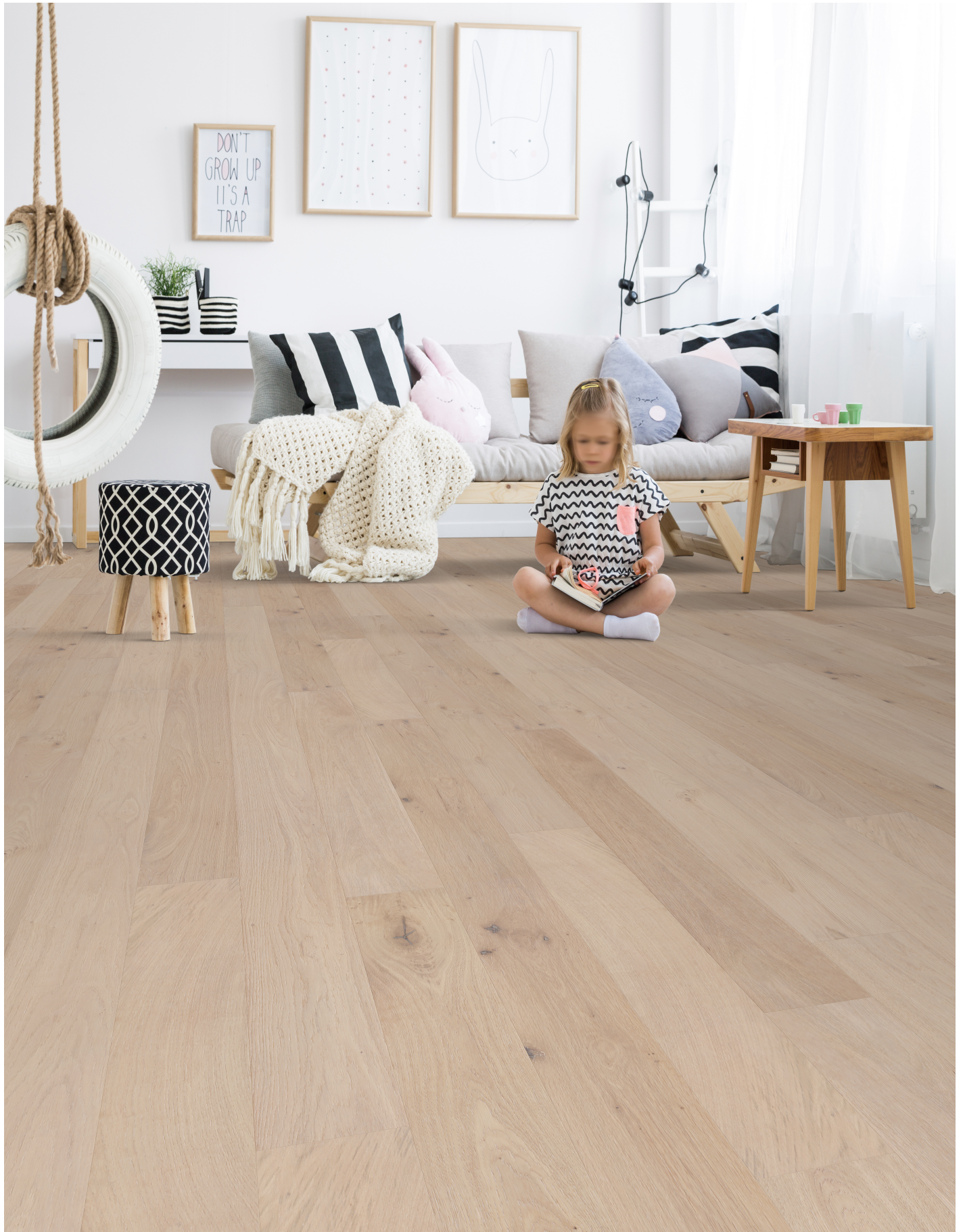
△ White Oak / Chêne blanc-Brighton | ENG728