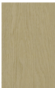
ENG2501 WHITE OAK/CHÊNE BLANC REFLECTION