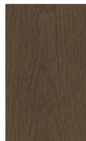
ENG2503 WHITE OAK/CHÊNE BLANC BISCUIT