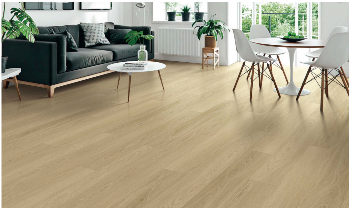
△ Cashmere Sand | VWP1516