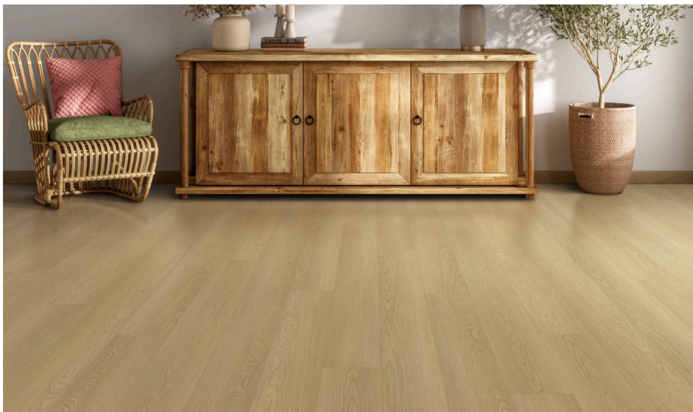
△ Beige Circuit | VWP1517