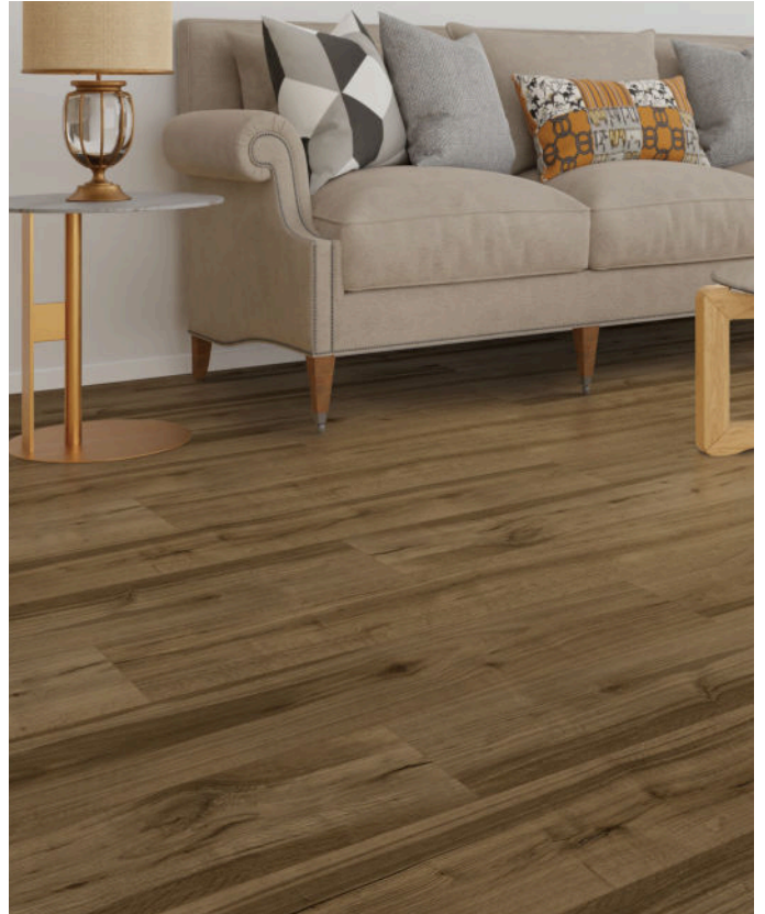
△ Smoke Barrel | VWP1521