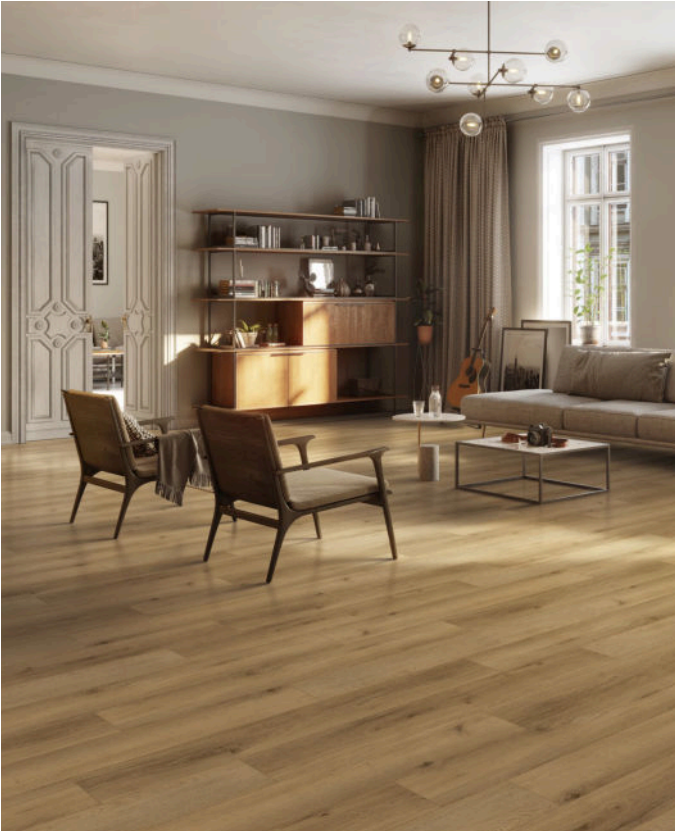
△ Wheat Grove | VWP1520