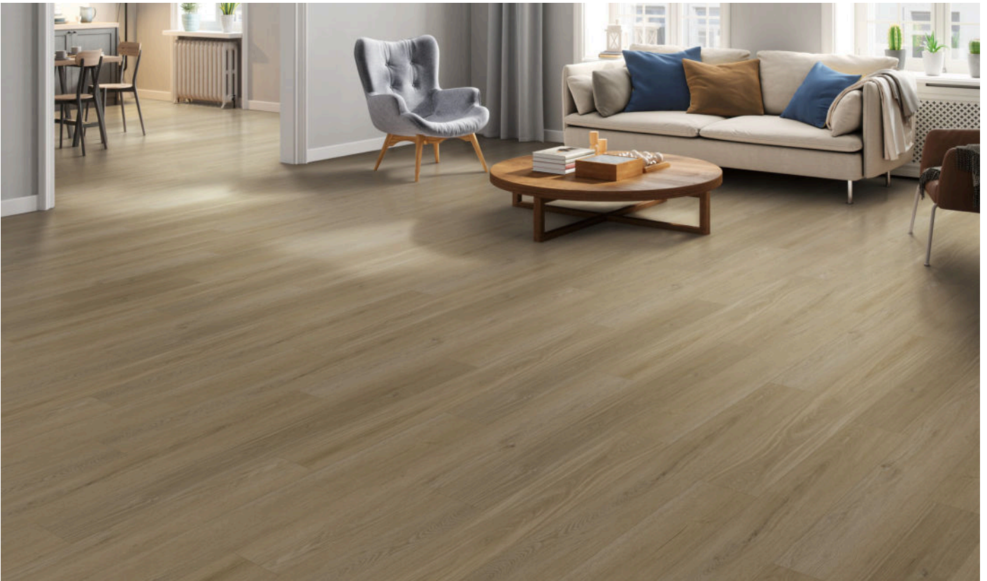
△ Truffle Dust | VWP1522