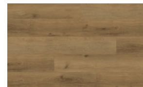
VWP1520 WHEAT GROVE