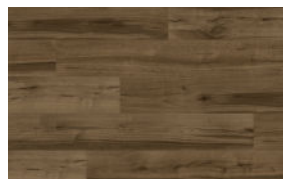
VWP1521 SMOKE BARREL