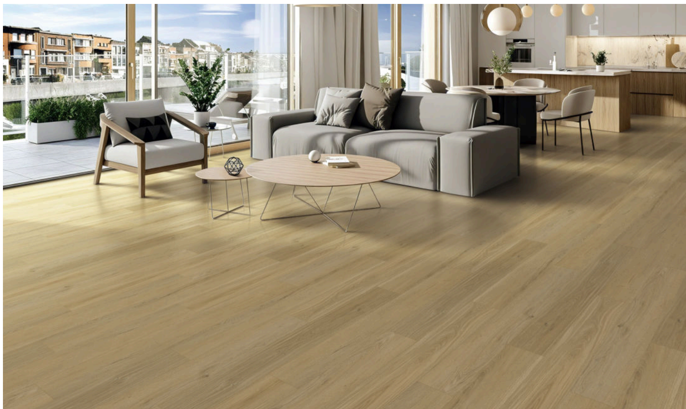
△ Brisa | VWP1518