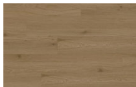
VWP1519 BURNT BRASS