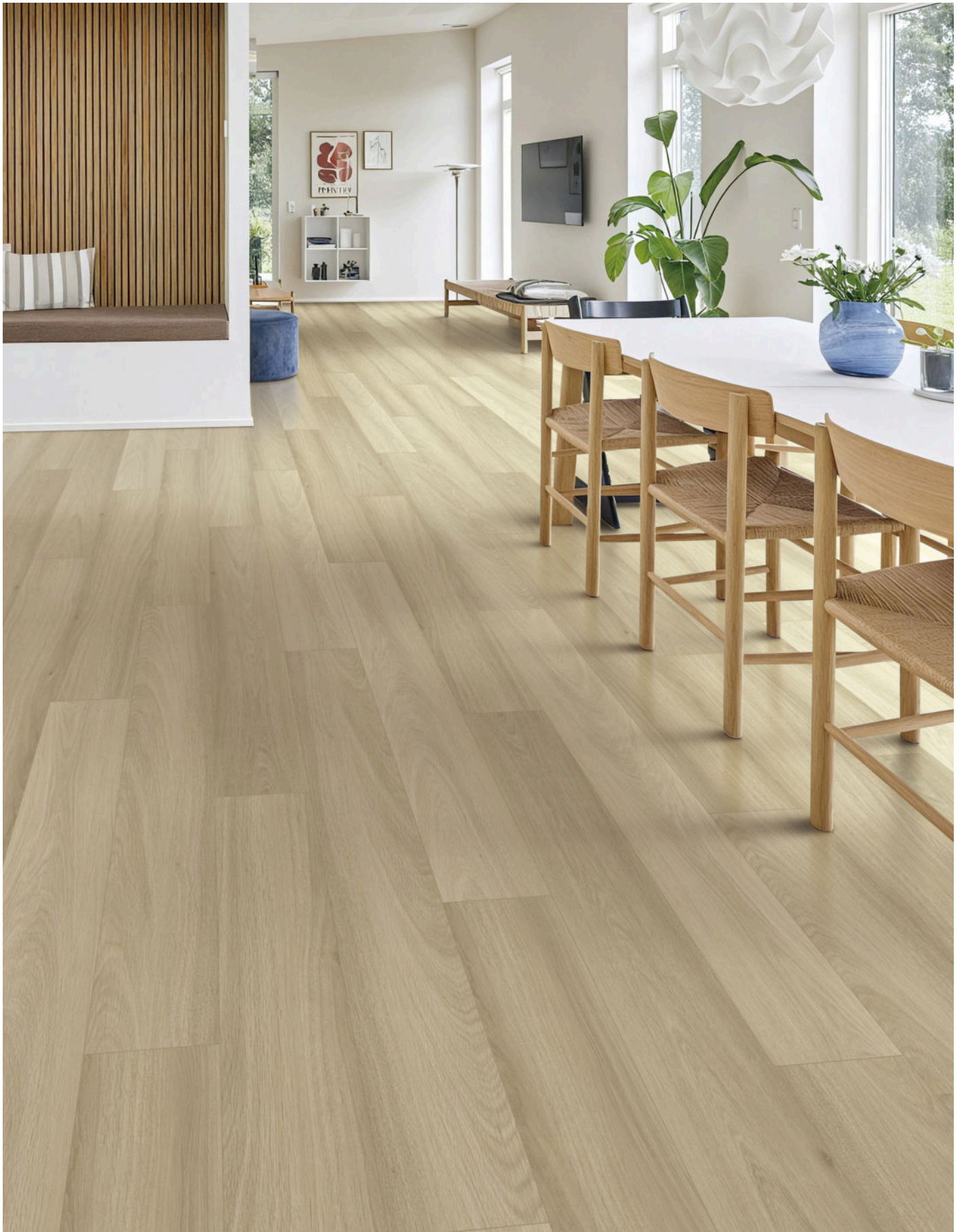
△ Bareline | VWP1515