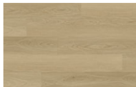
VWP1516 CASHMERE SAND