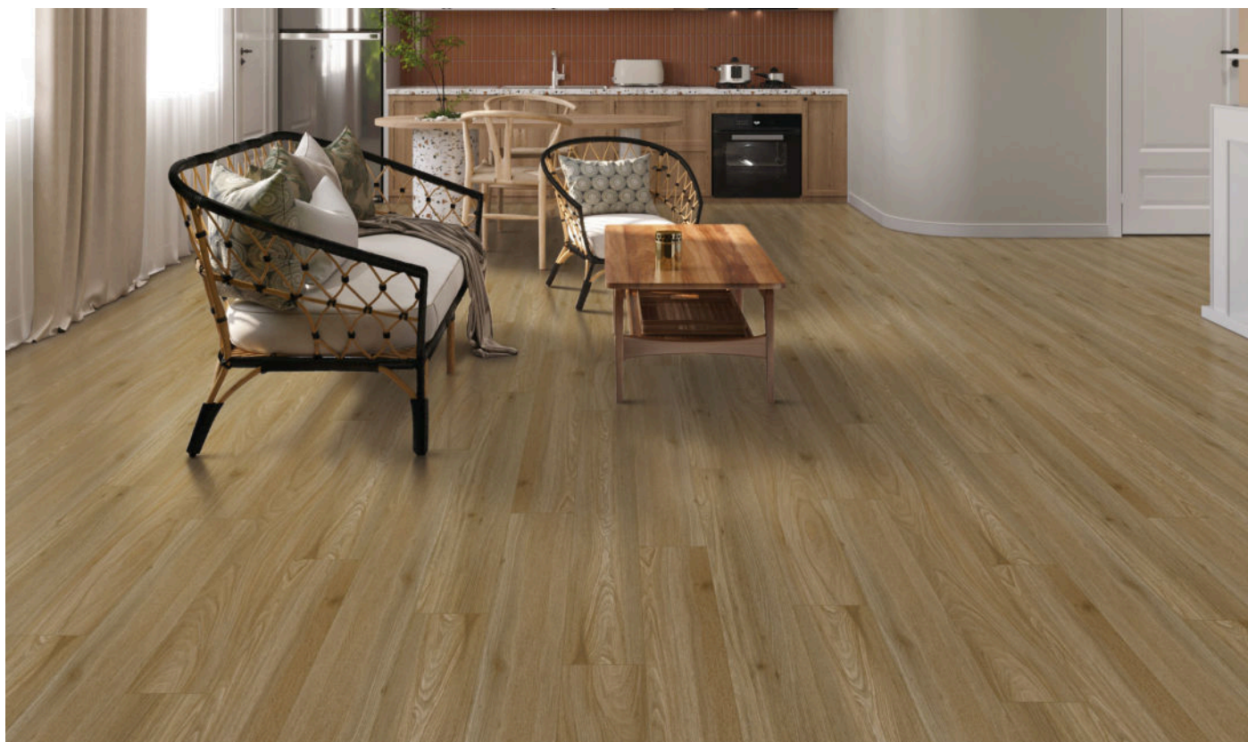
△ Burnt Brass | VWP1519