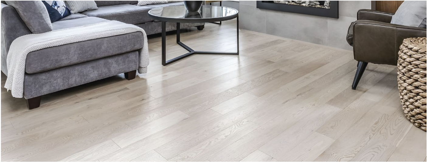
△ White Oak / Chêne blanc-Colonial | ENG701-T