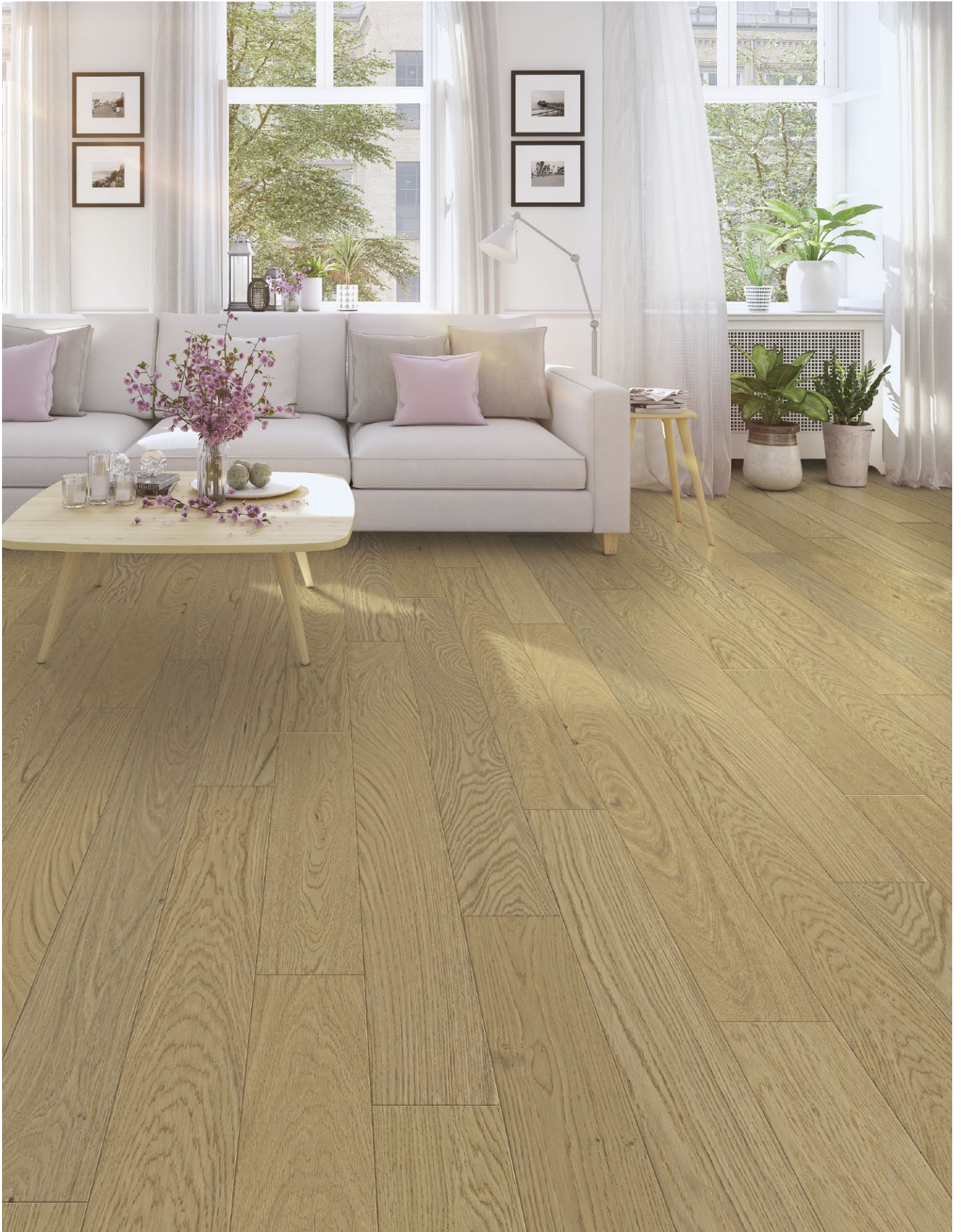
△ White Oak / Chêne blanc-Crafting Oasis | ENG2203