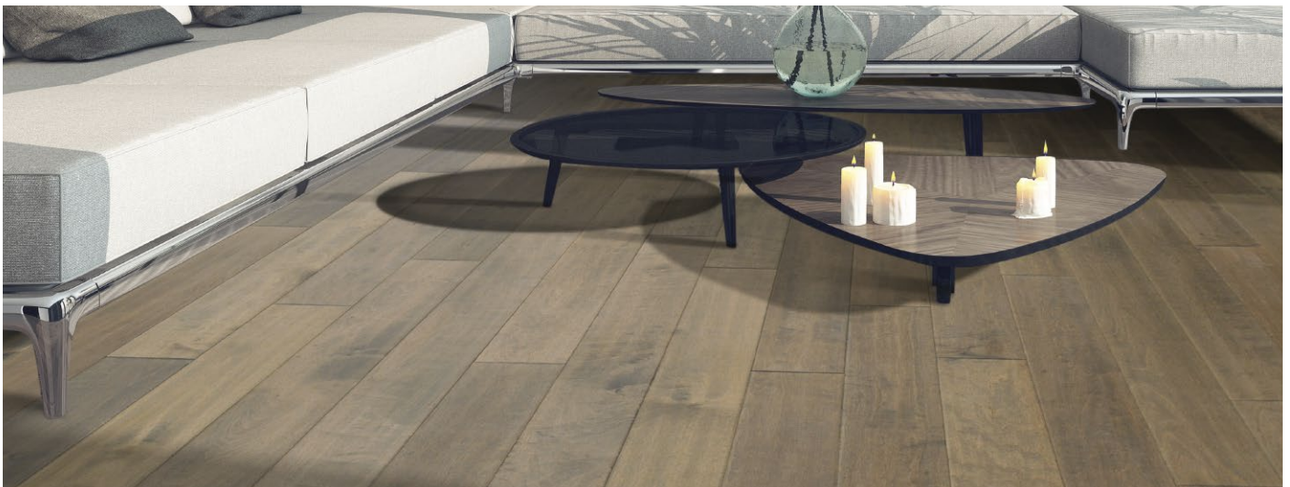
△ Maple / Érable-Castile | ENG705-T