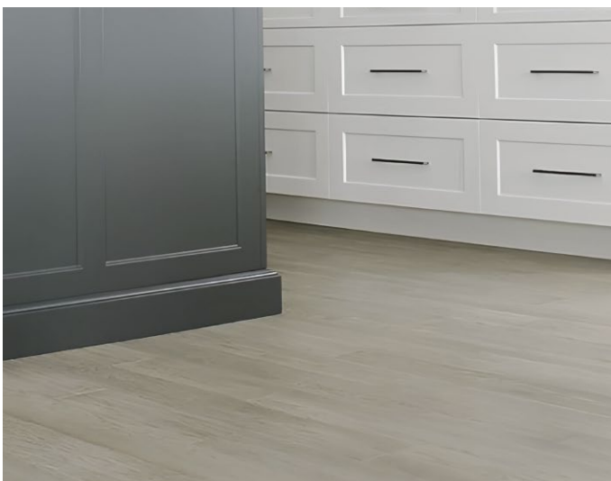
△ Hickory / Caryer-Caspian | ENG707