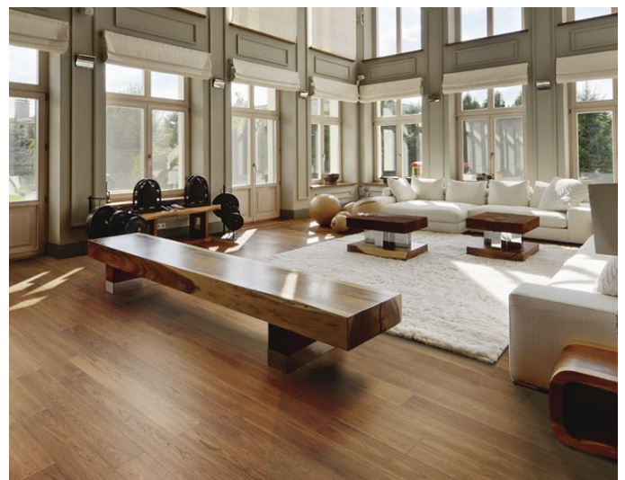
△ Hickory / Caryer-Chesapeake Bay | ENG709