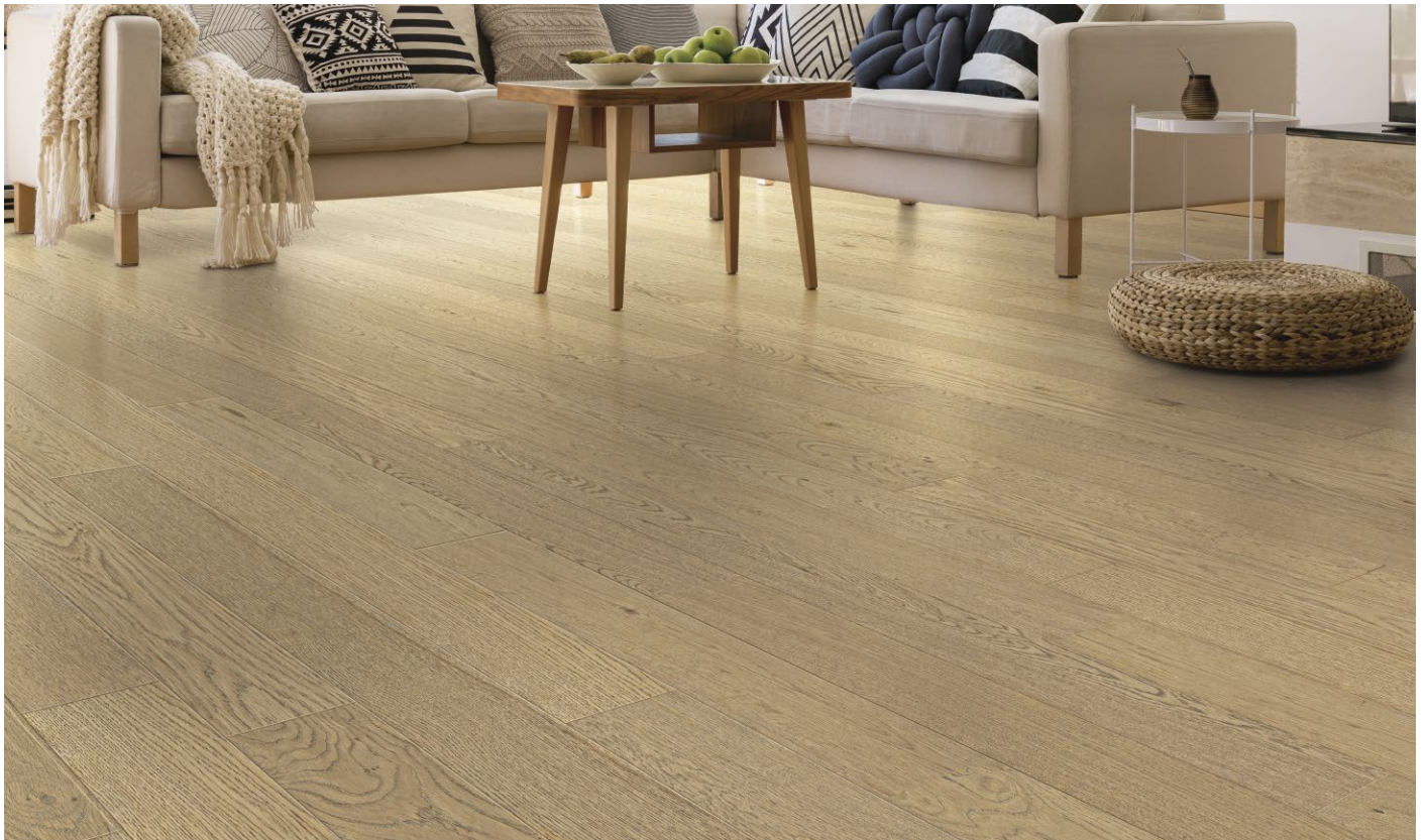
△ White Oak / Chêne blanc-Artisan's Haven | ENG2201