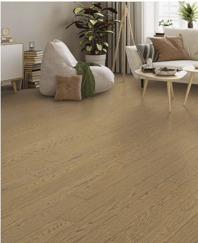
△ White Oak / Chêne blanc-Lovely Looms ENG2205