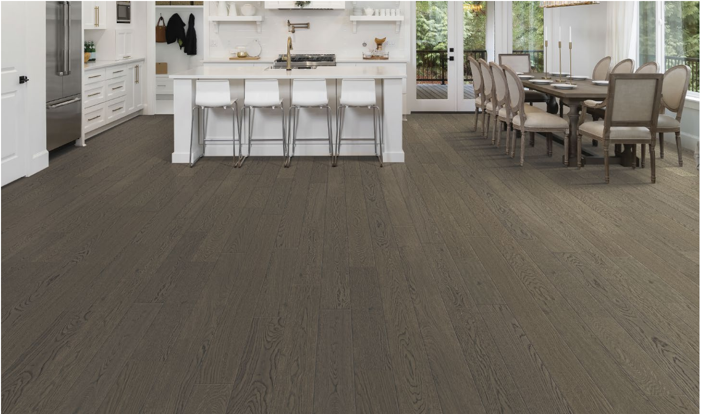
△ White Oak / Chêne blanc-Timeless Treasure | ENG2204