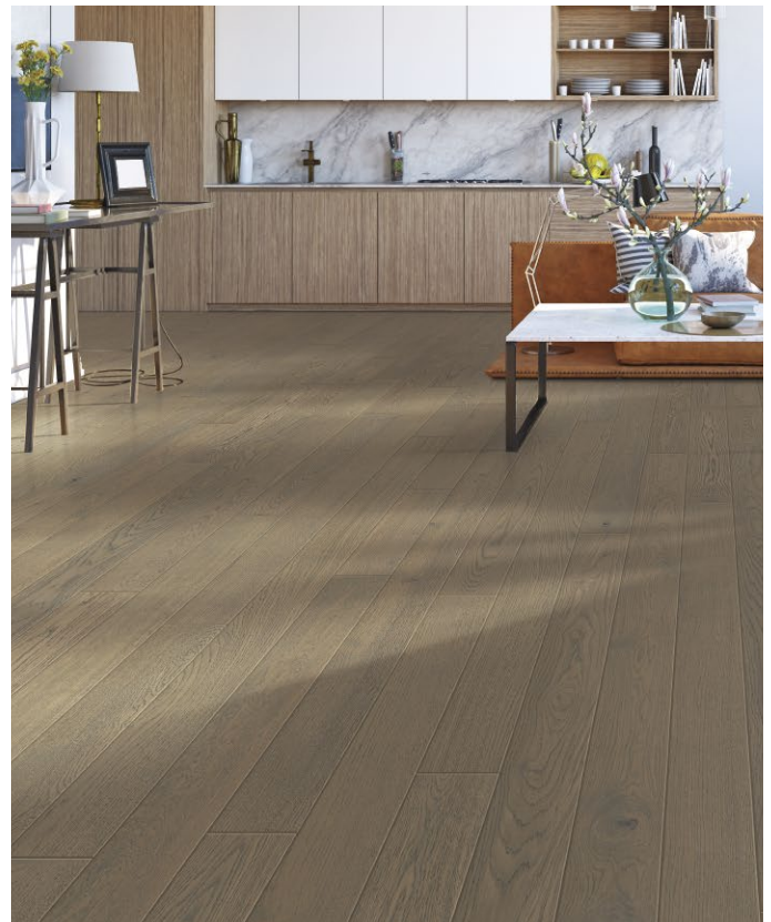
△ White Oak / Chêne blanc-Painted Paradise ENG2206