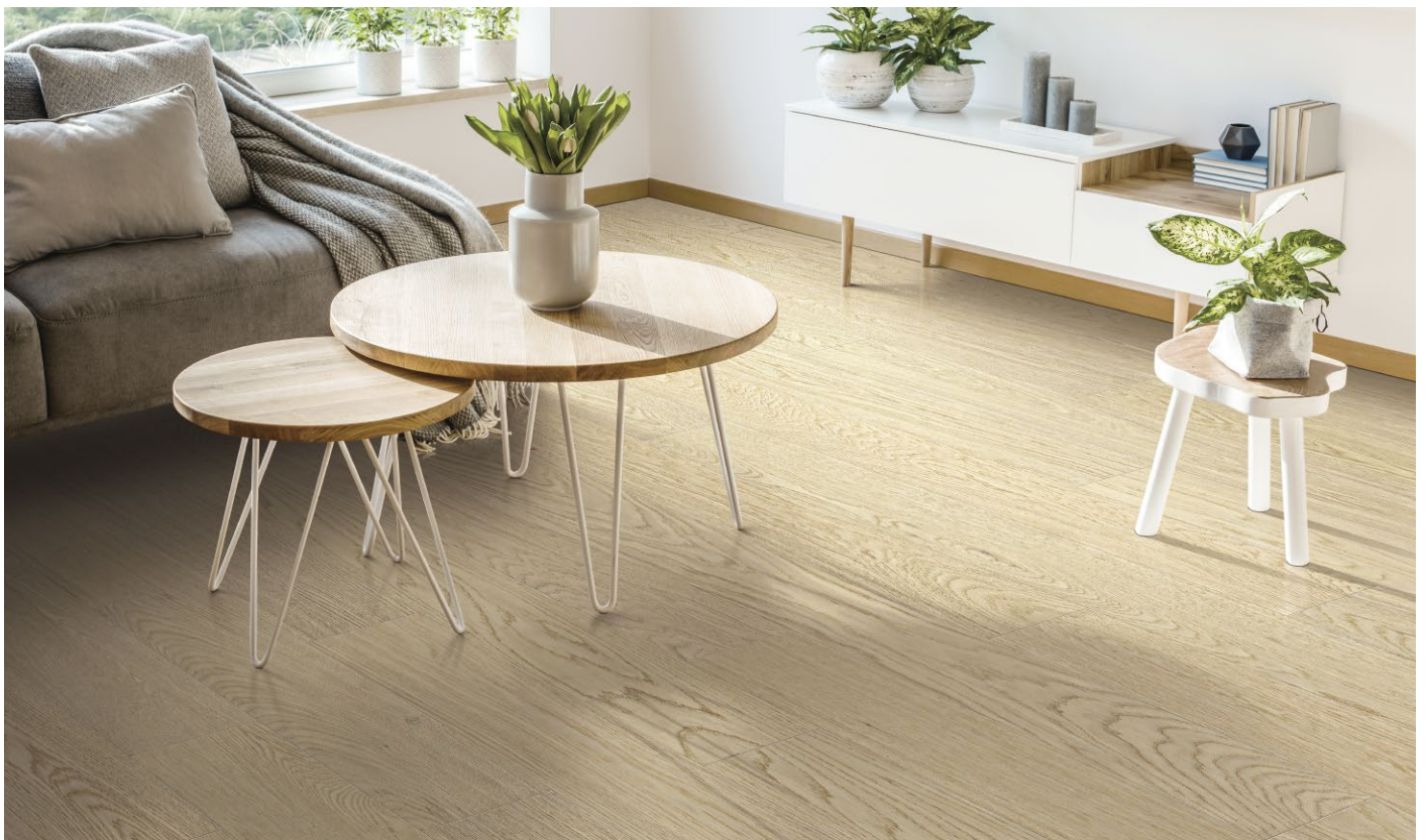
△ White Oak / Chêne blanc-Classic Revival | ENG2202